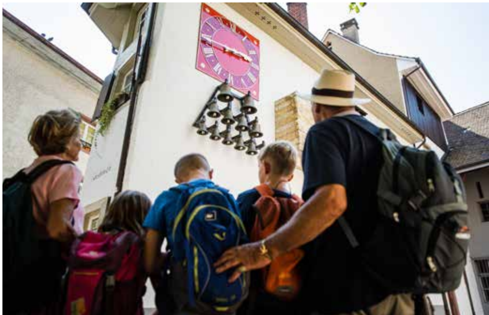
Familie vor dem Glockenspiel im Rumpel