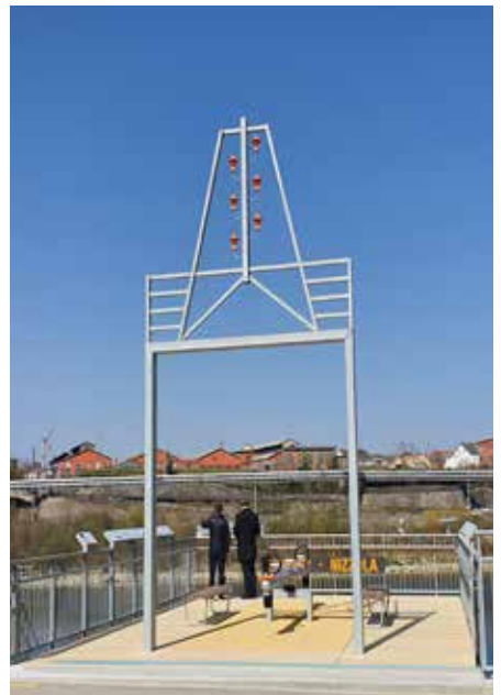
Ankunft der MS Rhystärn in Rheinfelden | Die Brown-Nizzola-Plattform mit der 50-Hertz-Wippe