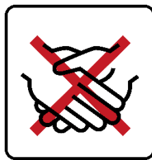
Hände schütteln vermeiden