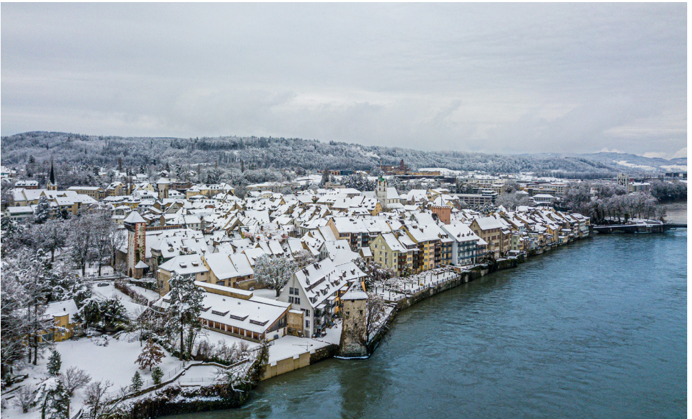
Blick über die Rheinfelder Altstadt im Winter 2020/21