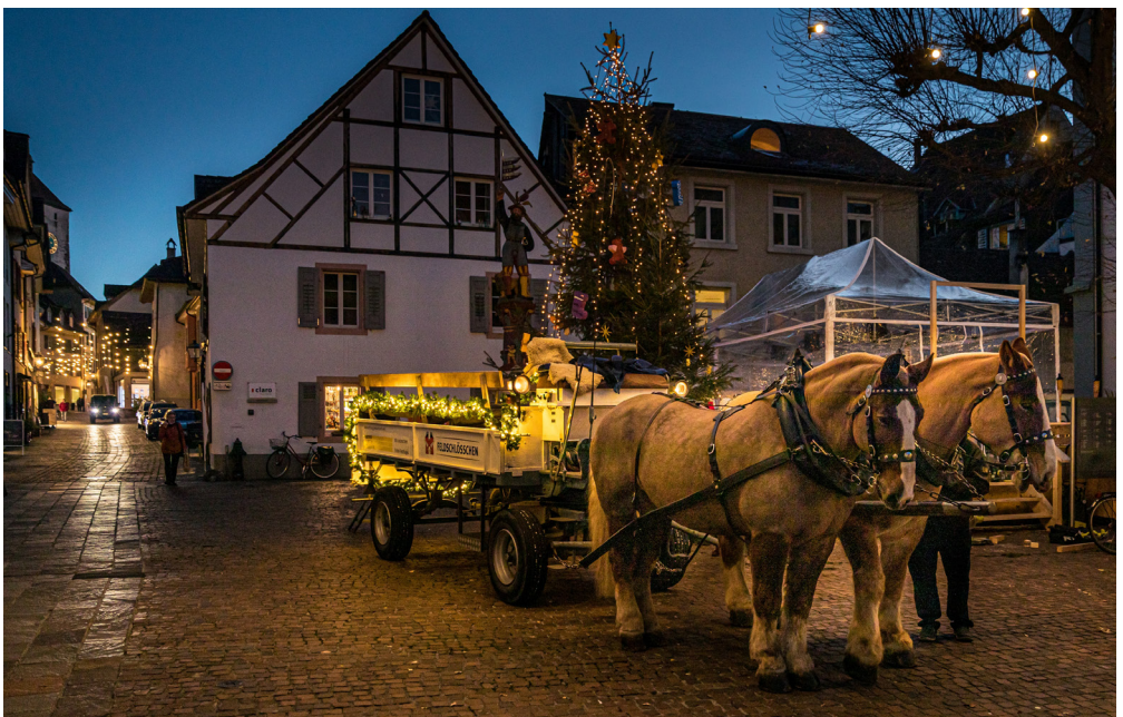
Kutschenfahrten im Advent: Zweispänner der Brauerei Feldschlösschen AG