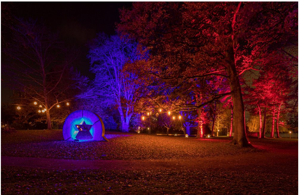
↑ Beleuchtung Stadtpark West am Adventsfunkeln

Das Interesse am Newsletter war während des ganzen Jahres ebenfalls gross. Die Anzahl Abonnenten erhöhte sich nur minim, die Öffnungsrate war mit 38% aber deutlich höher als in den Vorjahren (2019: 35,4%) und auch die durchschnittliche Anzahl Klicks auf die Beiträge war mit 10,2% höher als in den Jahren zuvor (2019: 7,8%)