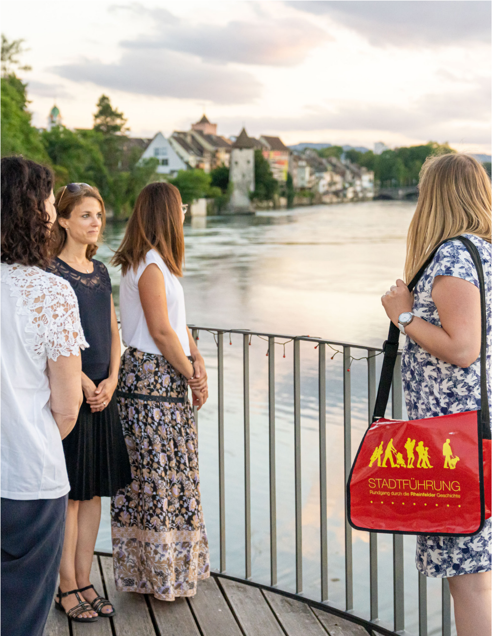
SalzGourmetTour auf der Terrasse des Park-Hotels am Rhein