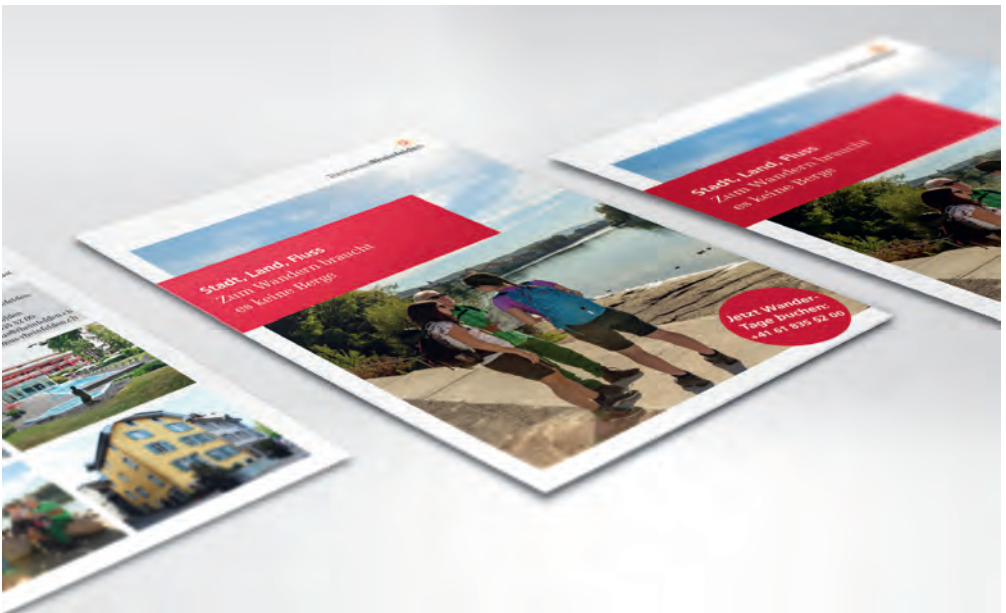
▲ Agnes von Rheinfelden auf dem Inseli ▼ Neues Angebot Stadt, Land, Fluss