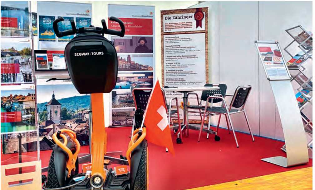
▲ Frühlingserwachen 2019 ▼ Expo19