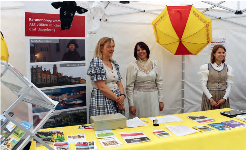
▲ Eintauchen in die Belle Epoque mit der VR-Brille ▼ Infostand am Frühlingserwachen