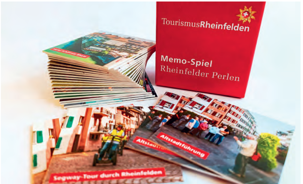
▲ Die neue Ortsbroschüre erscheint in drei Sprachen ▼ Das neue Rheinfelder Memo-Spiel