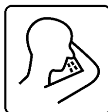
In Taschentuch oder Armbeuge husten und niesen