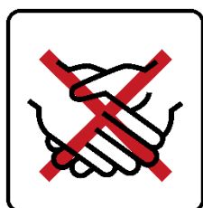
Hände schütteln vermeiden